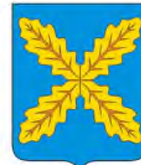
СХЕМА ТЕРРИТОРИАЛЬНОГО ПЛАНИРОВАНИЯ ХОХОЛЬСКОГО МУНИЦИПАЛЬНОГО РАЙОНА ВОРОНЕЖСКОЙ ОБЛАСТИ

Карта объектов капитального строительства, границ лесничеств и территорий, подверженных риску возникновения чрезвычайных ситуаций природного и техногенного характера