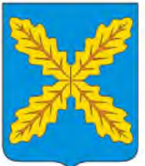
СХЕМА ТЕРРИТОРИАЛЬНОГО ПЛАНИРОВАНИЯ ХОХОЛЬСКОГО МУНИЦИПАЛЬНОГО РАЙОНА ВОРОНЕЖСКОЙ ОБЛАСТИ

Карта зон с особыми условиями использования территорий, особо охраняемых природных территорий и территорий объектов культурного наследия