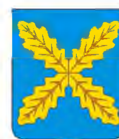
СХЕМА ТЕРРИТОРИАЛЬНОГО ПЛАНИРОВАНИЯ ХОХОЛЬСКОГО МУНИЦИПАЛЬНОГО РАЙОНА ВОРОНЕЖСКОЙ ОБЛАСТИ